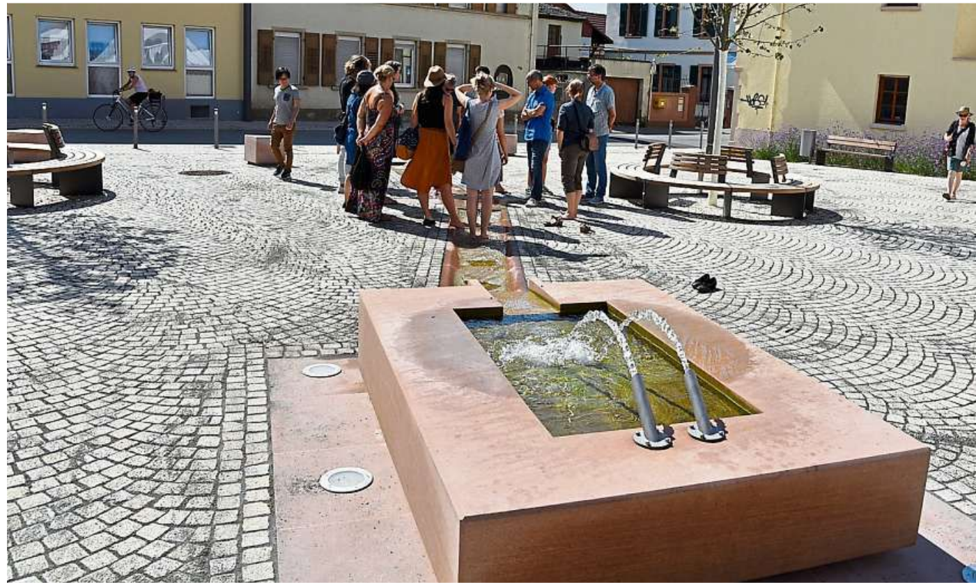
Zurzeit im Winterschlaf, aber im Sommer plätschert der Brunnen in Ober-Ingelheim.

INGELHEIM. Der „jüngste“ Brunnen – zurzeit im Winterschlaf – plätschert seit wenigen Monaten als Mittelpunkt des kleinen und feinen Platzes am Alten Gymnasium vor dem Stadtteilhaus in Ober-Ingelheim. Vielleicht war hierzu ein Ideengeber die frühere Wassertränke in der Nähe, die noch auf manch einer historischen Aufnahme zu erkennen ist. Der skulpturale Brunnen aus Sandstein mit einem Wasserlauf, der aus der Casinoquelle gespeist wird, erinnert zumindest an sie. An den gerade vergangene